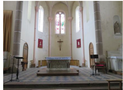
Le petit Jésus de Prague