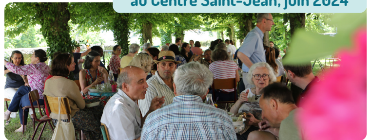
Assemblée de maison au Centre Saint-Jean, juin 2024