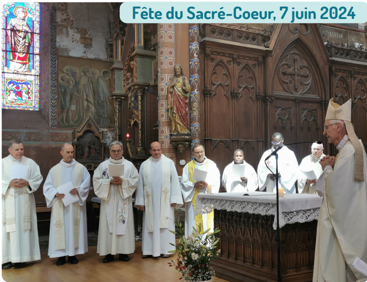
Fête du Sacré-Coeur, 7 juin 2024