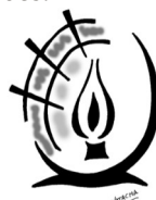
St Thomas d'Aquin

Seigneur, mets de l'ordre dans ma vie, et ce que Tu veux que je fasse, donne-moi de le connaître, donne-moi de l'accomplir comme il faut et comme il est utile au salut de mon âme. Que j'aïlle vers Toi, Seigneur, par un chemin sûr, droit, agréable et menant au terme, un chemin qui ne s'égare pas entre les prospérités et les adversités, en sorte que je Te rende grâce dans les choses prospères et que je garde la patience dans les choses adverses, ne me laissant ni exalter par les premières, ni abattre par les secondes. Seigneur, que toute joie me fatigue qui est sans Toi, et que je ne désire rien en dehors de Toi. Que tout travail, Seigneur, me soit agréable pour Toi, et tout repos insupportable qui est sans Toi. Donne-moi souvent de porter mon coeur vers Toi, et quand je faiblis, de peser ma faute avec douleur, avec un ferme propos de me corriger.